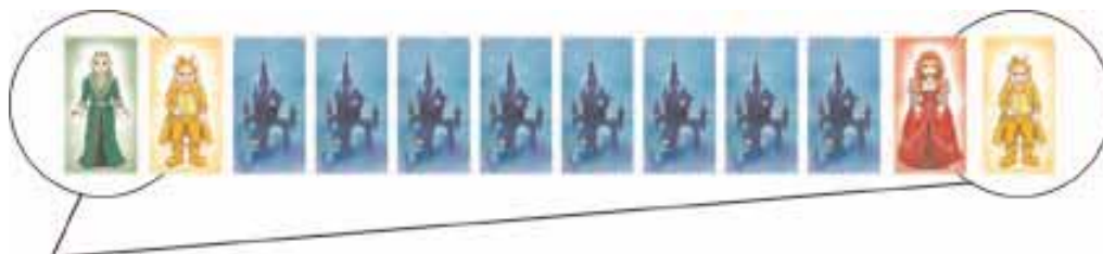
Fig. 1: At the beginning of the game, each player turns over 2 vampires at each end (left and right) of his vampire row. Only the outermost vampires (within the white circles) are compared to the grave lid color. In this example, the player has to find either a green or a yellow grave lid in order to put one of his vampires to rest.